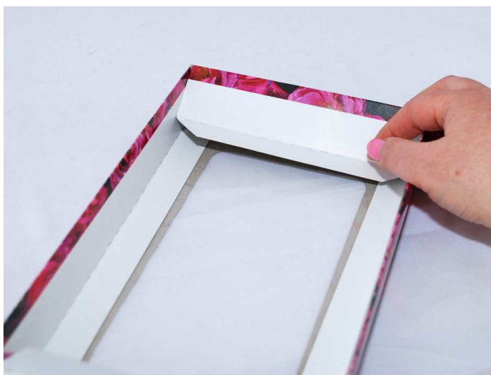
Krok 3 - Zavřením kratších boků dojde k zajištění celé konstrukce víka