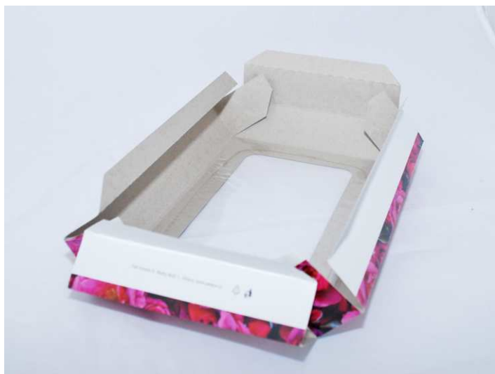
Krok 1 - Naohýbání všech boků, krajní části klop "v protisměru"