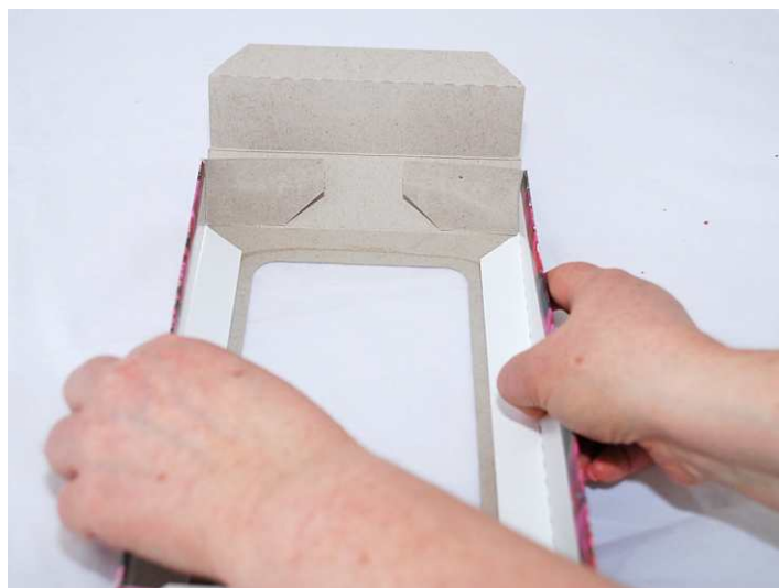
Krok 2 - Složení dlouhých boků a ohnutí vnitřních klopek